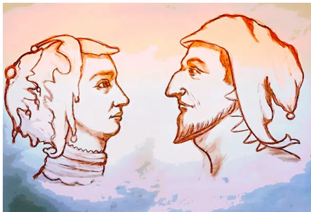
Copies des fresques de Jeanne du Lys et de Robert des Armoises au château du Jaulny et sur la porte sculptée du musée de la ville de Metz

On parle beaucoup des visites de Jeanne des Armoises au château maudit de Tiffauges, par Gilles de Rais, l'ancien compagnon d'armes de Jeanne d'Arc, ainsi que