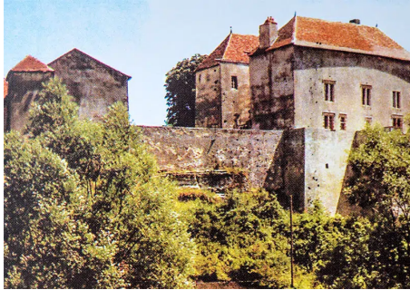
Le château de Jaulny, manoir où Jeanne des Armoises a vécu avec son mari Robert et où se trouve le portrait en couleur de Jeanne des Armoises.

Paleolithique Mes livres et ebooks ∨ éditions de la contre-histoire ∨ 🔍